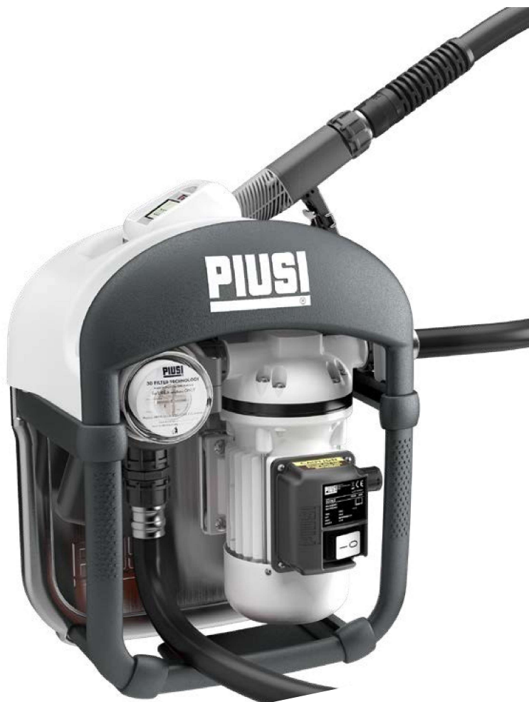
SUZZARABLUE 3 PRO